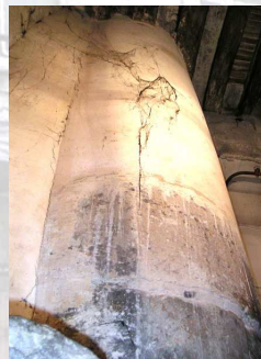
Le puits à l'intérieur de la maison