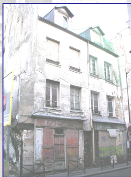
Construite vers 1608 Possède des caves voûtées, puits, structure interne intacte